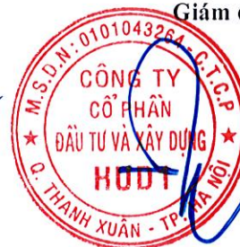
Dương Tất Khiêm