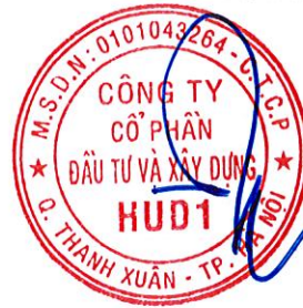
Dương Tất Khiêm